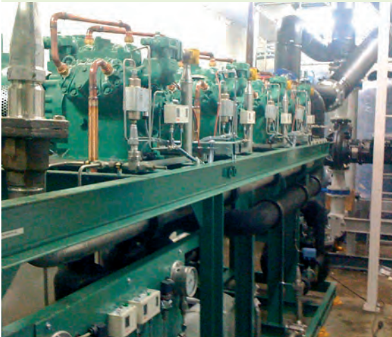
Blick in den Maschinenraum mit der ausgeführten Verbundanlage bei der Südbayerischen Fleischwaren GmbH.

betrieben, einem Gemisch aus Ammoniak und Dimethylether, das laut Datenblatt von Euramon einen sehr geringen GWP-Wert von 8 hat. Die gesamte Planung des Systems stammt von der Frigoteam GmbH, die auch die benötigten Bauteile lieferte. Die Übertragung der Kälte erfolgt mittels eines Kältsoldeerzeugers, wodurch kein Kältemittel in die Nähe der Lebensmittel gelangt – laut Baumer ein deutliches Plus an Sicherheit.