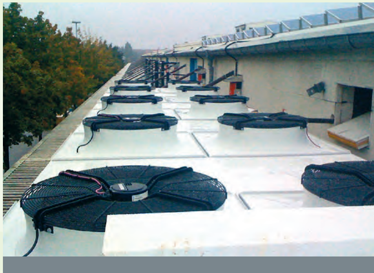
Verflüssiger auf dem Dach des Kühlhauses.

brauch pro Jahr und mit einem Einsparpotenzial von mindestens 35 Prozent. Der Zuschuss beträgt hier 15 Prozent der Investition oder 25 Prozent, wenn als Kältemittel Ammoniak, R723, CO 2 oder nichthalogenierte Stoffe verwendet werden. Neue Kälteanlagen können aus der Basisförderung ebenfalls 25 Prozent der Kosten erhalten, wenn sie diese Kältemittel verwenden, energieeffiziente Komponenten enthalten und der Jahres-Energieverbrauch mindestens 100.000 kWh beziehungsweise die Jahres-Energiekosten über 10.000 Euro betragen werden.