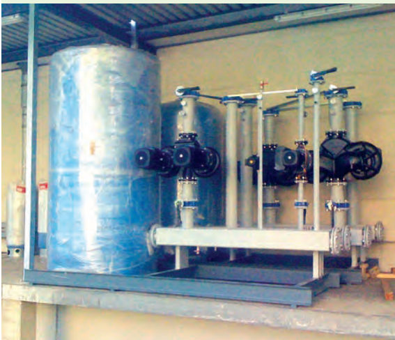
Vor der Installation: Pumpstation und Speicherbehälter für die Warmsole zum Abtauen der Verdampfer.

Seit April 2009 sind die Anlagen mit jeweils 150 kW Kälteleistung in Betrieb. Es zeigte sich bereits jetzt, dass weniger Energie zur Kühlung benötigt wird als bei den vorherigen Kälteanlagen, obwohl sich der Kältebedarf aufgrund der Erweiterung der Kühlräume erhöht hatte. Die alte Anlage hatte eine Kälteleistung von 2x70 kW. Die Abtauung erfolgte elektrisch. Die Kältsoldeerzeuger wurden zusätzlich mit einem Wärmerückgewinnungssystem ausgestattet, das zum Erhitzen von Brauchwasser eingesetzt wird. Gleichzeitig dient die so erzeugte Warmsole auch zum Abtauen der Soleluftkühler. „Seither sparen wir 3.000 Liter Heizöl pro Monat“, so der Leiter des Obertraublinger Werks. Die Gesamteinsparungen lassen sich noch nicht absehen, die ersten Schätzungen gehen aber von rund 35 Prozent aus. Damit würde sich die Investition innerhalb von drei Jahren amortisieren.